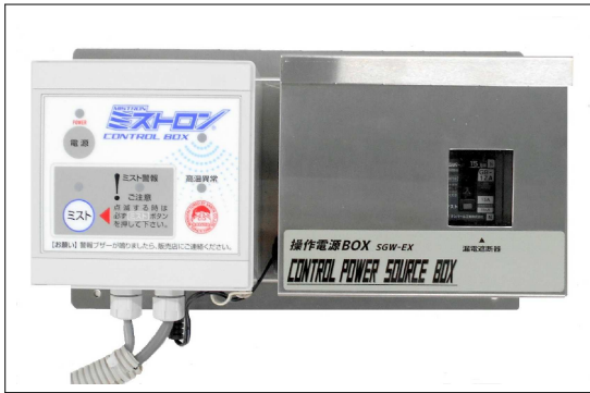
コントロール・電源ホック 300W × 93D × 162H